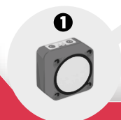
1 Capteur de distance à ultrasons