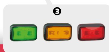
3 Feux 3 fonctions